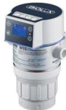
型號：EOS7177-Q 圖中僅為產品參考圖

採用革命性的AOP (高級氧化程序) 技術，取代傳統的UV或化學劑處理食水及供水線的清潔消毒。活氧將水中物質分解後，會自然地轉化為氧氣，水中並不會留下任何化學殘留物，過程安全而且十分環保。